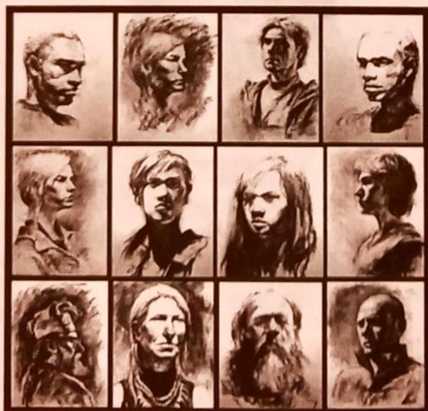
Hình 1.1. Vẽ chân dung nam, nữ

Nghiên cứu mẫu người luôn là mục tiêu và có vai trò hết sức quan trọng trong học tập và sáng tạo nghệ thuật. Sự hiện diện của con người trong các tác phẩm hội họa và điêu khắc luôn là niềm say mê sáng tạo của họa sĩ.